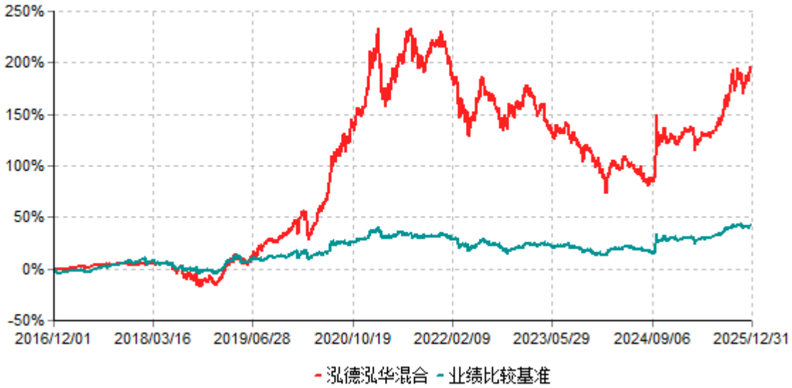
泓德泓华混合累计净值增长率与业绩比较基准收益率历史走势对比图 (2016年12月01日-2025年12月31日)

注：根据基金合同的约定，本基金建仓期为6个月，截至报告期末，本基金的各项投资比例符合基金合同关于投资范围及投资限制规定。